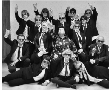
Les Pops Castafiores en concert, c'est bon pour la santé!

Les Pops Castafiores poursuivent leur périple gersois et se produiront