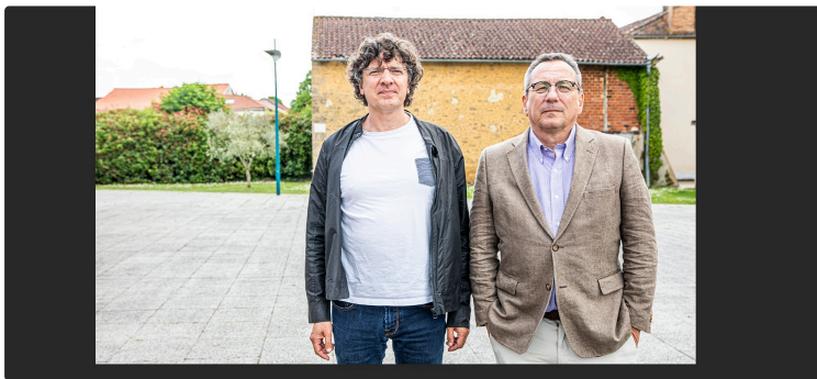
Programme des Rencontres littéraires à Nogaro et ailleurs sur 4 jours