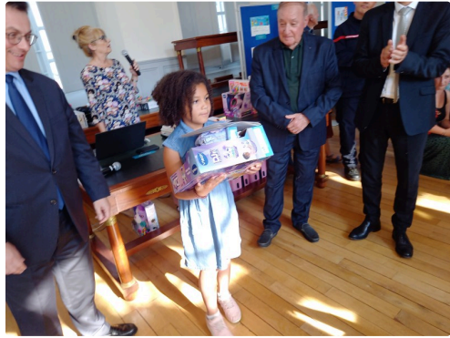
Des cadeaux plein les bras.