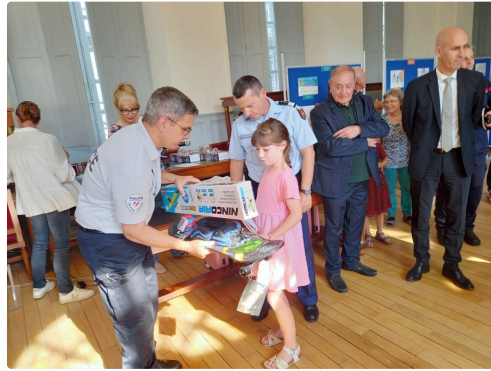
Des cadeaux plein les bras.