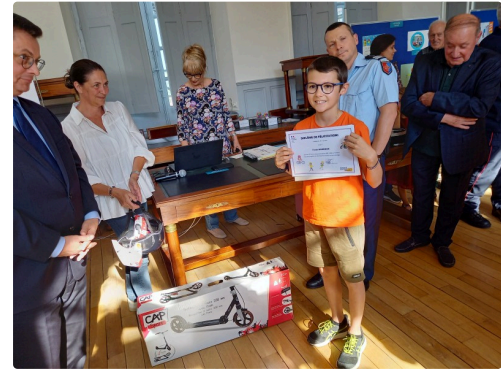
Des cadeaux plein les bras.