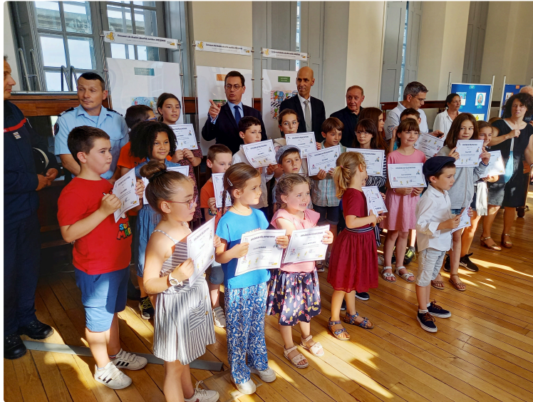
Concours de dessin sur la sécurité routière : 21 lauréats récompensés

C'est dans les salons de la préfecture que le mercredi 31 mai en début de soirée que se déroula la remise des prix du concours de dessins sécurité routière 2022-2023. Une cérémonie qui se déroula en présence du préfet du Gers, Xavier Brunetière, qui en profita pour sensibiliser les 21 jeunes lauréats aux dangers liés à la sécurité routière. Lesquels ont été sélectionnés parmi les 575 dessins réceptionnés issus de 8 centres de loisirs et de 18 écoles. Ce concours qui avait pour thème : « Pour être un piéton en sécurité, je fais attention et je me protège », était organisé en partenariat avec l'Education nationale, la Prévention routière, la gendarmerie et la police.