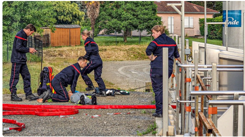
Réanimation d'un blessé