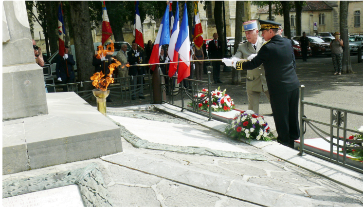
commémoration de la guerre d'Indochine

Jeudi 8 juin à 11 heures au monument aux morts de la place Salinis à Auch s'est déroulée la cérémonie de commémoration de la guerre d'Indochine en présence des autorités civiles et militaires et des associations d'anciens combattants. Cette journée nationale d'Hommage aux morts pour la France en Indochine a été instituée par le décret du 26 mai 2005.