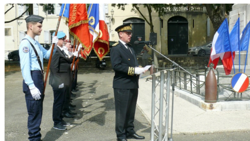
Lecture du message ministériel par le préfet du Gers.