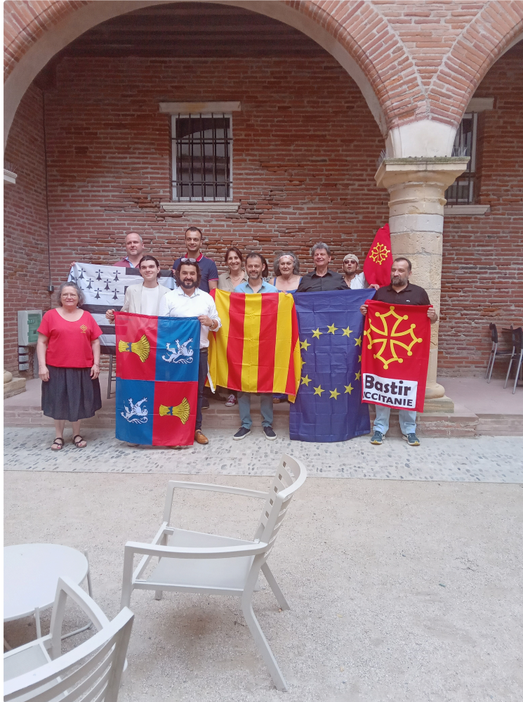
Occitanie País Nòstre a organisé à Toulouse une rencontre d' associations et de groupes occitans...

Occitanie País Nòstre a organisé le samedi 3 juin à l'Ostal d'Occitania de Toulouse, dans la salle du restaurant la « Taula » une rencontre d'associations et de groupes occitans avec des mouvements régionaux dont la plupart sont membres de la Fédération des Pays Unis.