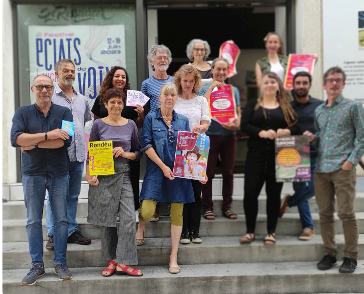
Musique, poésie, théâtre , contes, danses ... au programme de l'été, les associations font leur festival

L'Adda du Gers, en lien étroit avec le Comité Départemental du Tourisme, s'attache à accompagner les festivals et événements culturels gersois dans une transition écologique collective et vertueuse, quelques uns d'entre eux ont été présentés récemment .