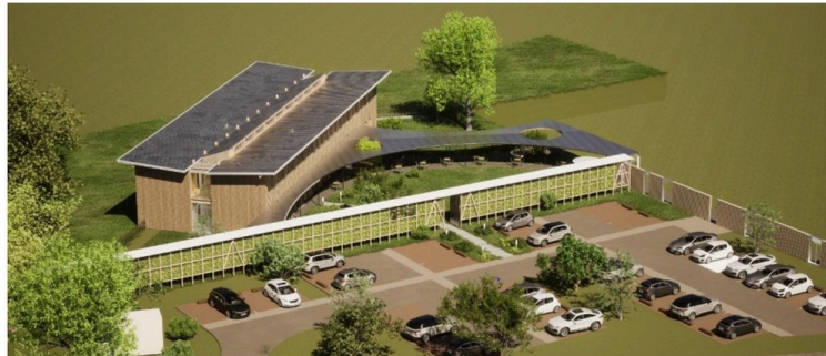
NATAIS: Projet en écoconstruction.

Portes Ouvertes le 16 juin de 9 h à 12 h