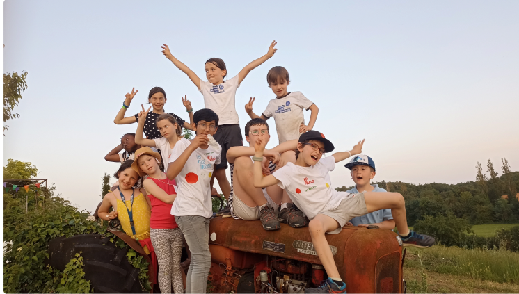
Belle réussite du festival Les P'tits moussent édition 2023 !

C'est sous un soleil radieux que les enfants et les parents de la joyeuse équipe des P'tits moussent ont eu le plaisir d'accueillir plus de 300 personnes à la Petite Pierre, à Jegun, le 27 Mai dernier.