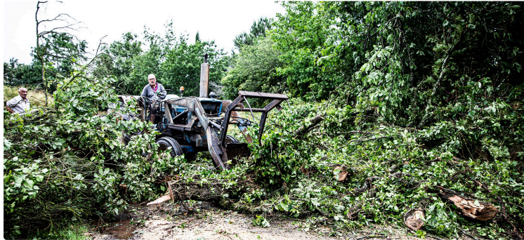
Dégâts de la tempête du 22 juin 2023 à Bouzon-Gellenave et Fustérouau

Arbres déracinés, arbres cassés, toiture envolées, coulées de boue sur les routes, champs inondés etc.