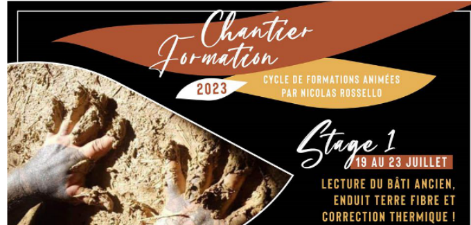
Chantier-école au Château Neuf des Peuples !

Fin juillet prochain, l'association Château Neuf des Peuples propose un chantier-école encadré par un artisan local en rénovation traditionnelle.