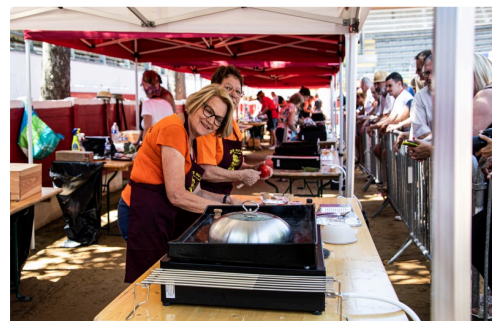
3 Une équipe au travail 1bis 240623.jpg