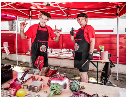
4 Autre équipe 1bis 240623.jpg