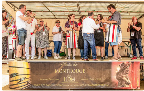
Proclamation des résultats et remise des cadeaux