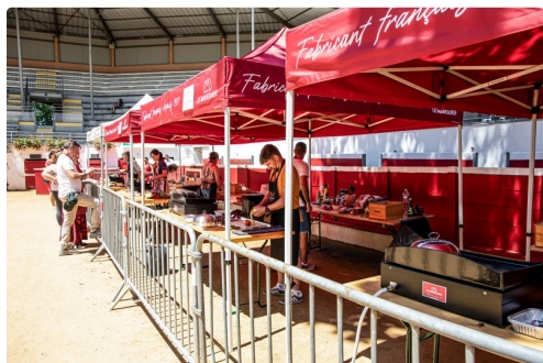
5 Une des 2 galeries de planchas 1bis 240623.jpg

N.B. - Sur la photo du haut de page, les 5 équipes finalistes sont alignées, (l'équipe gagnante est à l'extrême gauche) ; sur l'estrade, le jury.