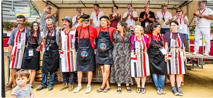
Résultats du Championnat de France de plancha amateur à Nogaro

13 équipes de 2 personnes ont concouru: la gagnante est celle de Viella