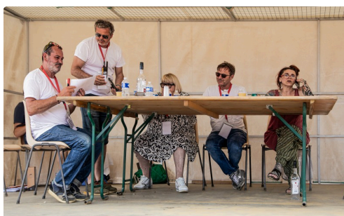
Le jury délibère dimanche après-midi