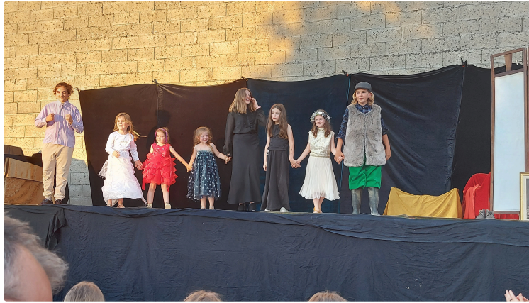
Le bonheur est dans le pré quand le théâtre s'y invite !

Quelle jolie idée que de proposer un spectacle de fin d'année en pleine campagne !