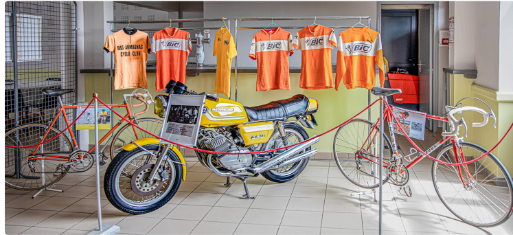
Une plaque dans la salle des fêtes consacrée à Luis Ocaña à Caupenne-d'Armagnac

Une salle mini-musée éphémère dédié à Luis Ocaña