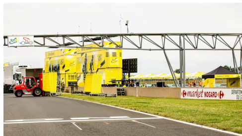
Un bâtiment a surgi