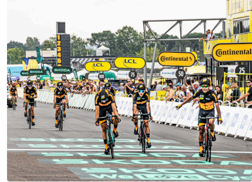
Un groupe de jeunes à l'arrivée