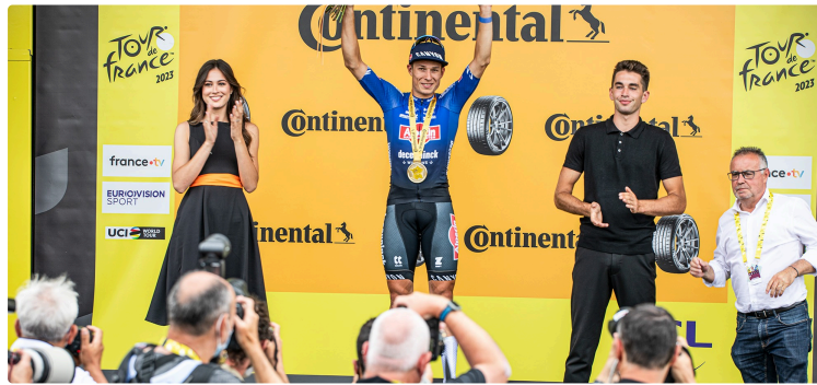
La caravane et les installations du Tour de France à Nogaro (I)

La journée du mardi 4 juillet est très occupée : le matin, les équipes du Tour finissent la mise au point opérationnelle de la montagne de matériels mise en place au bord du circuit Paul-Armagnac et, dès le début de l'après-midi, on assiste :