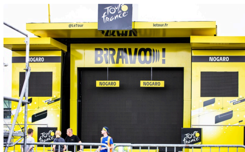
Le bâtiment du podium surgi du néant