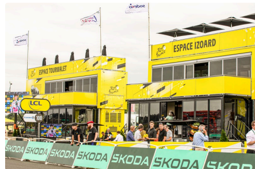
Au bord de la piste

Nous avons été bluffés par le bâtiment du podium qui n'a pas seulement une scène pour la remise des récompenses, mais un écran de télévision géant et la possibilité de faire apparaître une quantité d'autres écrans. À noter qu'une fois le départ de l'étape donné à Dax, l'écran du podium et celui de l'arc de l'arrivée ont permis de suivre les opérations tout au long de la route.