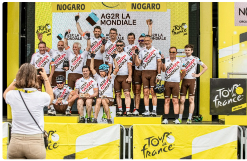
Les cyclos de la Mondiale sur le podium