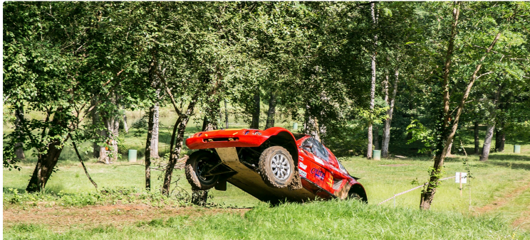
Le Rallye tout-terrain Terres d'Armagnac à Nogaro, Toujouse, Perquie, Pujo du 07 au 09 juillet 2023