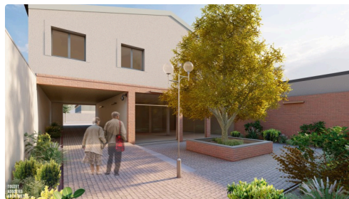
401-TAA-PCG-VUE DEPUIS CARNOT-cr.jpg