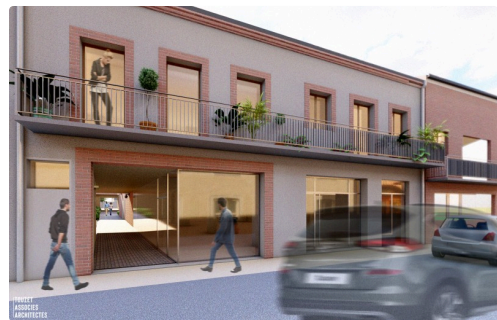
401-TAA-PCG-VUE BD CARNOT.jpg

Ces travaux engendreront de fortes perturbation sur la circulation du centre-ville durant environ 2 semaines.