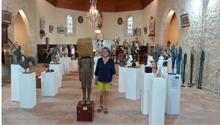
Avoz'art fête ses 10 ans ! Le festival ouvre ses portes samedi prochain !

Le 29 juillet, s'ouvrira le festival de sculpture de Mourède organisé par la sculptrice Béatrice Fernando, un festival qui a acquis ses lettres de noblesse et dont la renommée dépasse aujourd'hui largement les frontières du département.