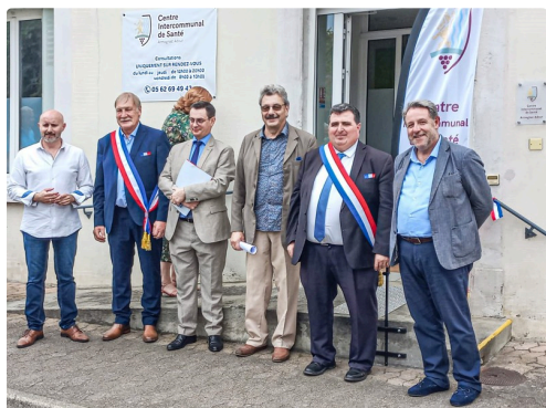
Inauguration du CISAA le 13 juillet