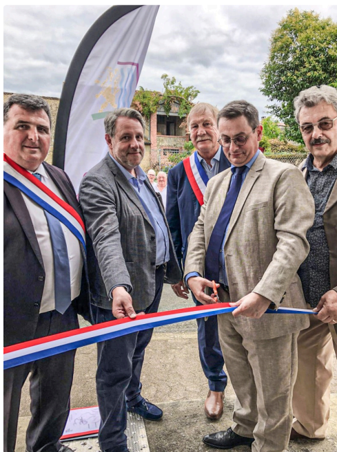
Le ruban est coupé