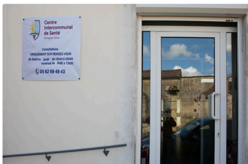
L'entrée du CISAA