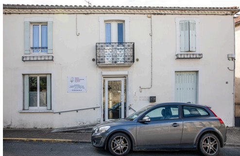
Le bâtiment du CISAA à Riscle

N.B. - Sur la photo du haut de page : le docteur Angel Gimeno Gascon au CISAA.