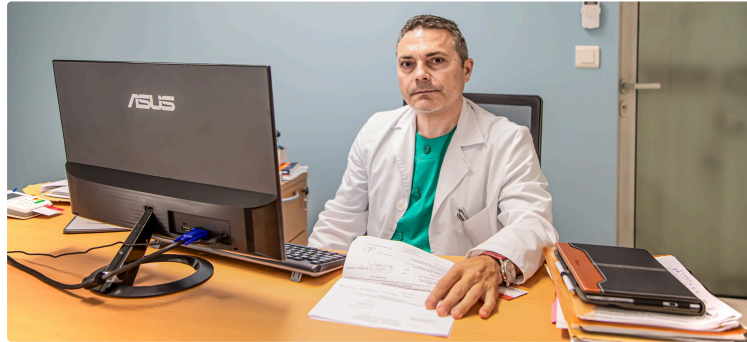
Le Centre Intercommunal de Santé Armagnac-Adour vient d'ouvrir à Riscle

Le Journal du Gers a rencontré un des médecins