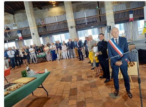
Reconnaissance pour le Mr le Maire d'auch