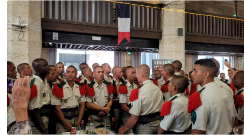
Dans la maison de Gascogne, ils ont gratifié l'assistance de quelques chants