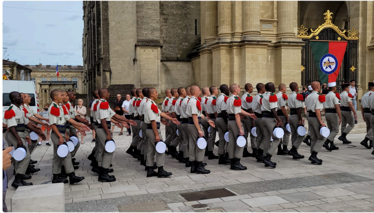
Les nouveaux légionnaires ont reçu leur képi blanc sur le parvis de la cathédrale Sainte Marie

Après une marche de 50km de Lectoure à Auch