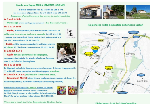
programme ronde des Expos 2023 Sémeziez-Cachan (2).jpg