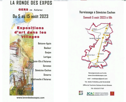
affiche plus flyer et circuit jp (1).jpg