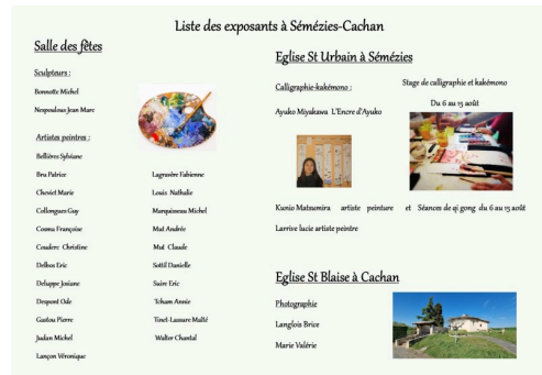
liste artistes 1 jp (2).jpg

Photos : liste des artistes, programme, flyer.