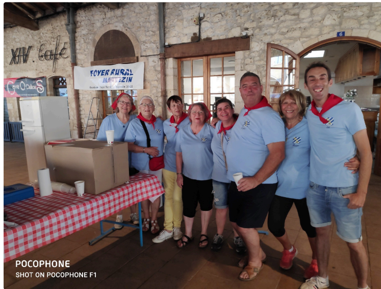
Prochain marché gourmand nocturne jeudi 3 août