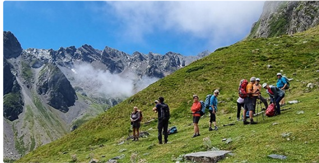
La Marmotte Gersoise au Lac du Lavedan