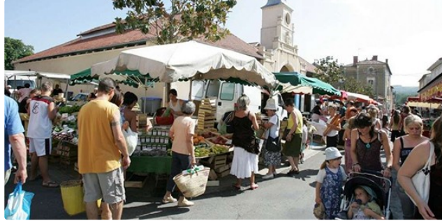
Le bus "marché" améliore service et trajet

Un service gratuit pour seniors et personnes à mobilité réduite