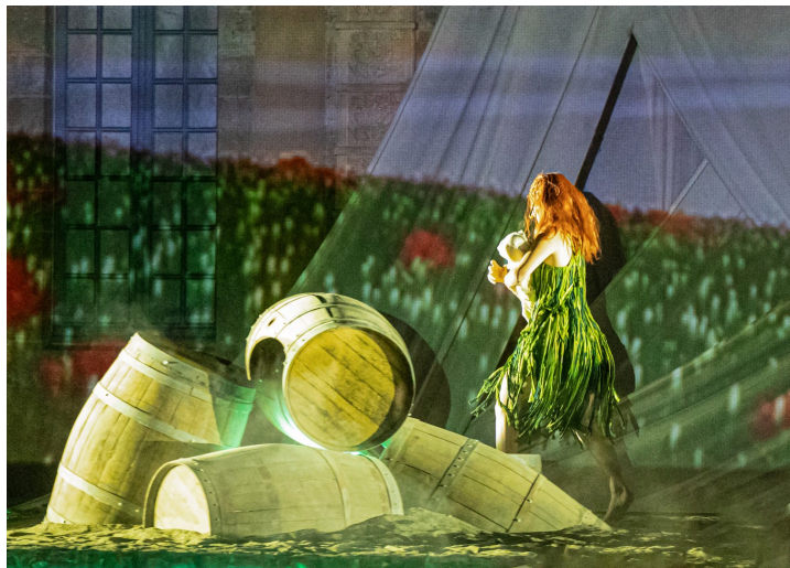
La nymphe recueille Dionysos bébé

Il découvrira son véritable rôle, lorsque la vérité sur ses origines le guidera de l'Olympe aux Enfers. Mais il provoquera la révolte des dieux en dérobant le nectar sacré avec l'ambition de l'offrir aux hommes.