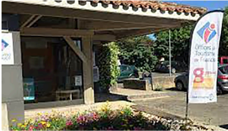
Une heureuse initiative de la municipalité

Le choix est laissé au citoyen qui pourront s'exprimer facilement