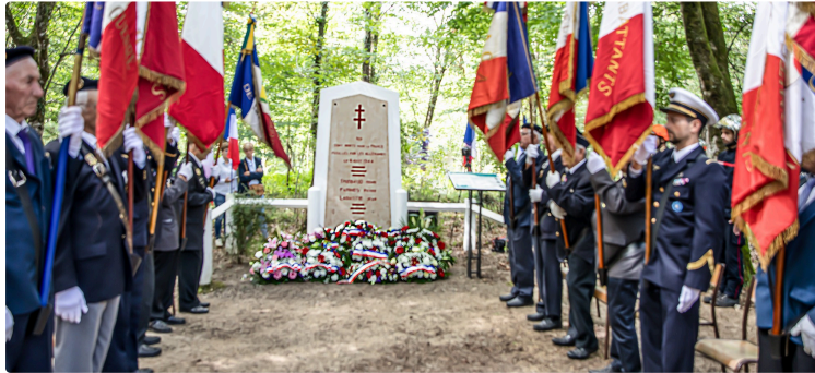
Faire vivre le souvenir des fusillés du bois de Bascaules, capturés près du Houga

La double commémoration suscite toujours le même recueillement