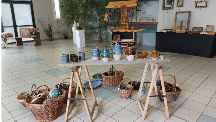
Venez à la rencontre des artistes au Festival L'Art des Eléments !

Après Art à Roques puis Avoz'art à Mourède, c'est dans le village de Castillon Debats que vous avez rendez-vous ce week-end avec l'art.