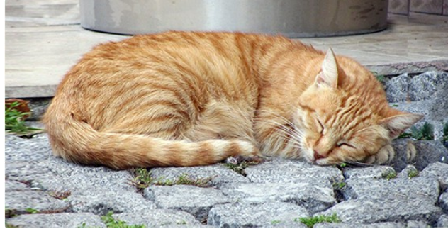
Le sommeil est précieux pour bien vivre

les bons gestes, les petites habitudes utiles divulgués gratuitement