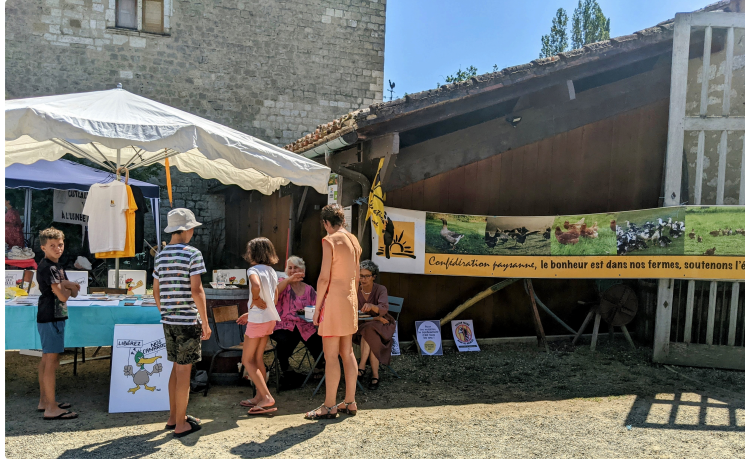
Le Festi'ferme de la Confédération paysanne : une fête paysanne à la ferme Guillot à Saint-Arailles le 17 septembre!

L'évènement traditionnellement organisé lors du premier week-end d'août a été déplacé après les vacances d'été dans l'espoir de pouvoir réunir davantage de citoyen.ne.s et de paysan.ne.s lors de cette journée militante et festive.