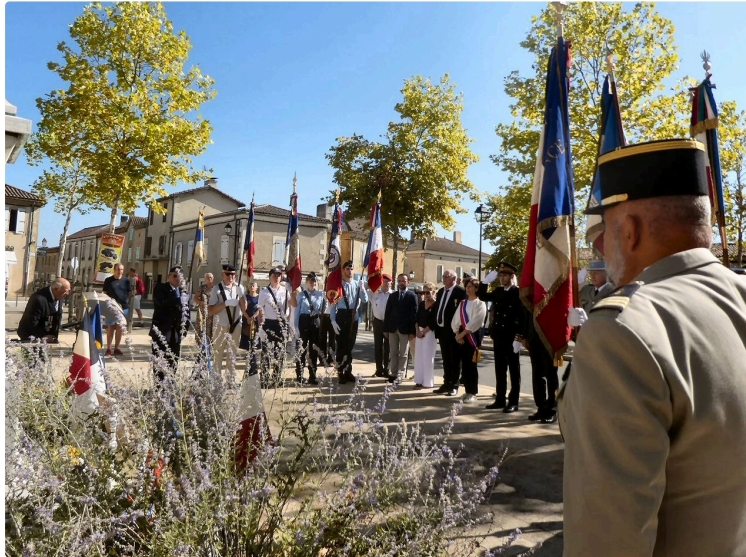
Le massacre de la Sidi-Brahim , commémoré par les Chasseurs de tous les régiments

Depuis plusieurs années, c'est au pied du monument de la place Carnot que les Chasseurs du Gers rendent hommage aux 8 officiers et 252 sous-officiers, clairons, caporaux et chasseurs qui sont tombés le 26 septembre 1845, au Maroc, dans la province d'Oran ,après une résistance de trois jours face aux troupes de l'Emir Abd El Kader , laissant seulement 16 survivants . Ce massacre, dont chaque épisode a été rappelé au début de la commémoration, étant devenu le symbole de la détermination et de l'esprit de sacrifice des Chasseurs, « faire la Sidi Brahim » est devenu pour eux une commémoration incontournable avec notamment la présence du colonel DMD ( Directeur Militaire du Département) et de Mr le sous-préfet de Mirande .