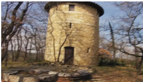
le moulin de Vernon ou de Sonnard