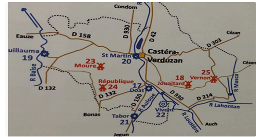
carte des Moulins de Castéra