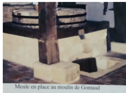
Meule en place au moulin de Gontaud