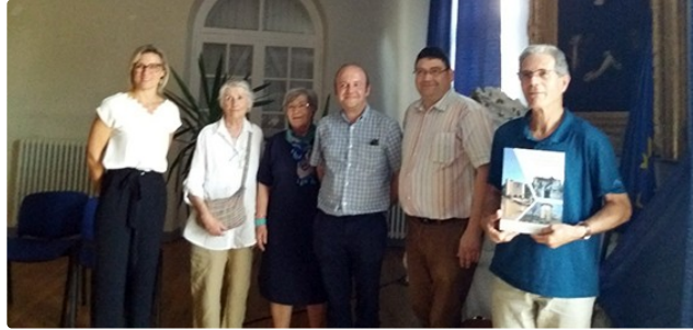
Une belle histoire de Moulins