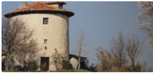
Moulin de la république