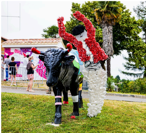
Vache et mannequin écarteur au Houga

N.B. - La photo du haut de page a été communiquée par Pierre Guichanné.