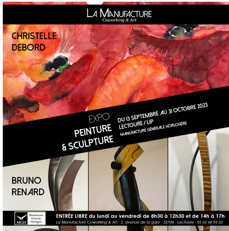
Nouvelle exposition à la Manufacture Coworking & Art

exposition de deux artistes gersois, un vernissage , une " Pause Web " organisée en partenariat avec la CCI et la reprise de La Matinale avec l' Office du Tourisme Gascogne Lomagne