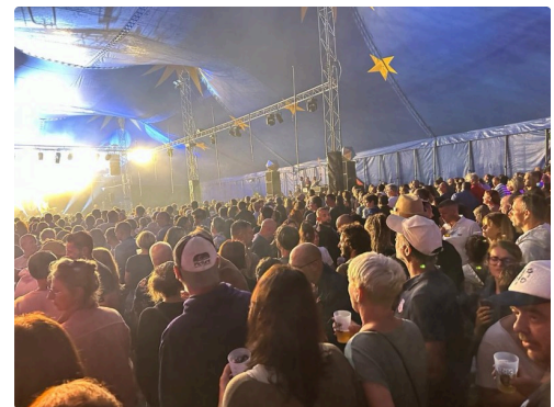
A l'intérieur du chapiteau la communion avec les rockers