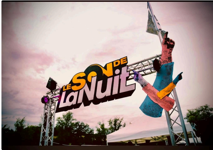
Derniers échos du " Son de La Nuit" : un festival qui a attiré une foule importante et enthousiaste