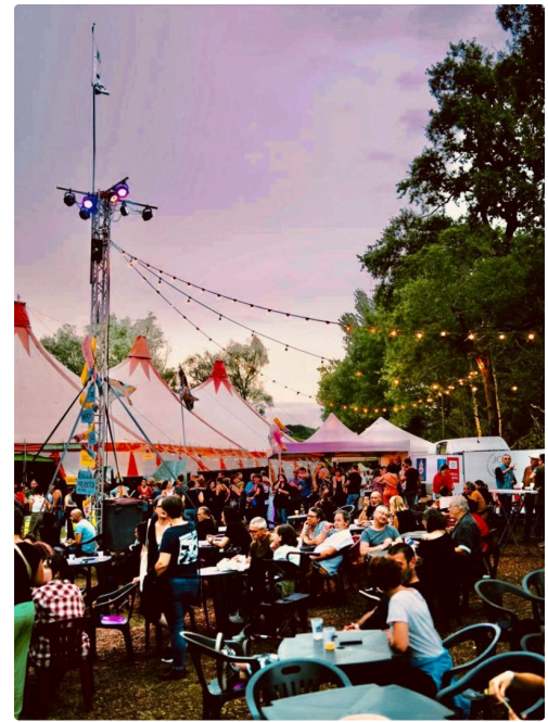
A l'extérieur du chapiteau les spectateurs flânent et se restaurent