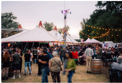
LSDLN-SPADAFORA-BENEVOLE ET DECO-2023-HD-52.jpg