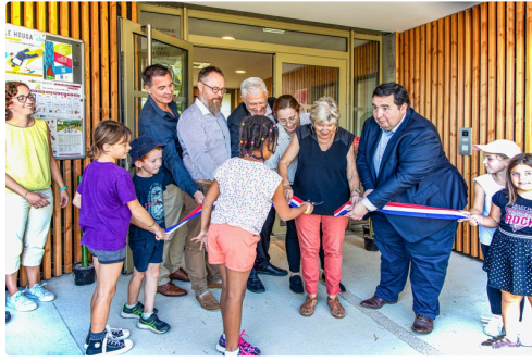
Le ruban est coupé !