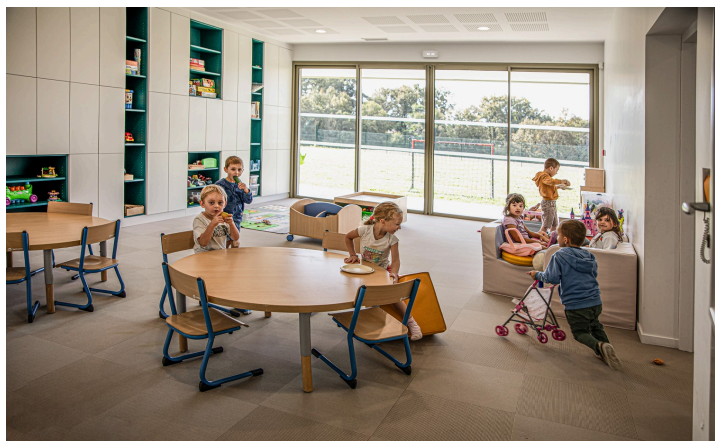
Autre salle de jeu

La CCBA poursuit son objectif de créer un service public de l'enfance de qualité et de proximité, avec, notamment, « le rééquilibrage de l'offre d'accueil sur tout le territoire de la CCBA », ainsi que la relance de la fréquentation des installations.