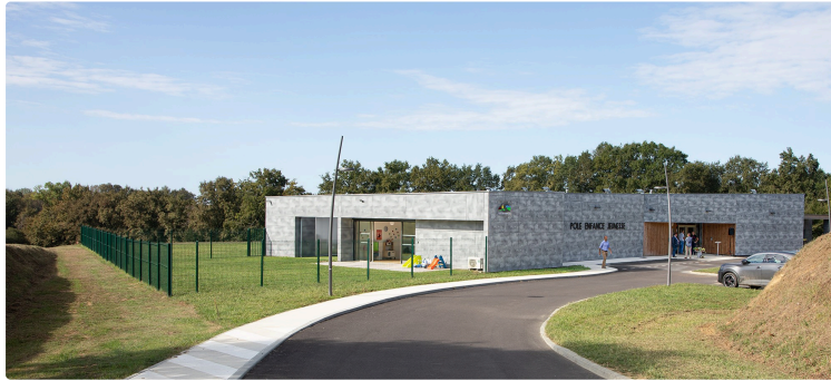
Le pôle enfance-jeunesse du Houga inauguré le 20 septembre

En présence de la plupart des maires de la Communauté de communes du Bas-Armagnac (CCBA)