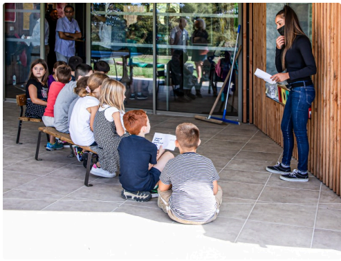
En pleine activité