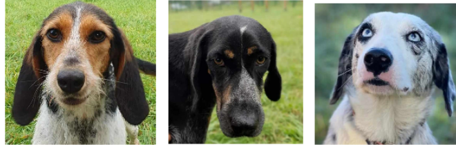
Les trois jeunes demoiselles de la semaine !

Cette semaine, la SPA nous présente trois jeunes demoiselles, Nougat, Pistache et Purple !