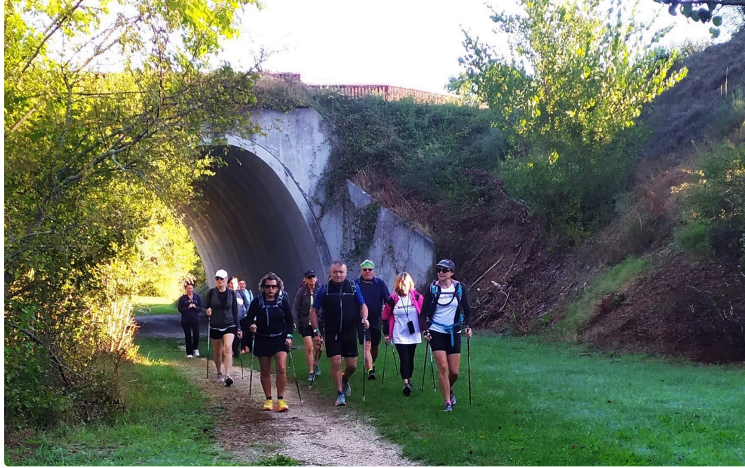
Le "32 du 32" a réuni avec bonheur des sportifs aguerris et des randonneurs au rythme plus raisonnable