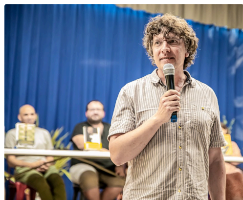
Éric Busson présente Lucas Belvaux, cinéaste et romancier le 2 juin 2023

N.B. - Sur la photo du haut de page : la salle de l'assemblée générale avec les nouvelles vice-présidente (à gauche) et présidente.