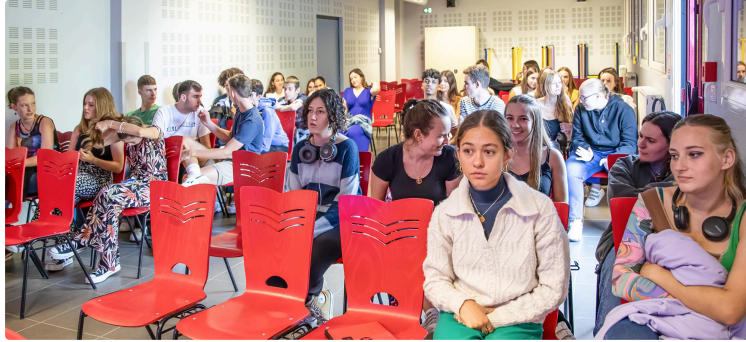
«Un Livre dans la poche» fait le bilan des Rencontres littéraires de Nogaro en 2023

Et laisse entrevoir la 19e édition en 2024