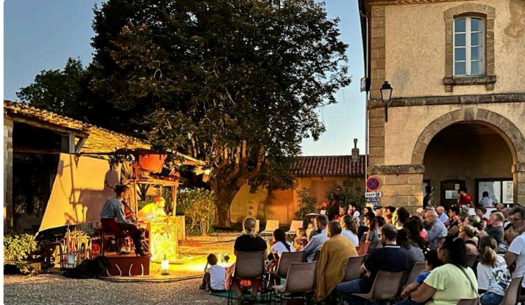
Les pirates ont envahi Peyrusse Grande ! Une réussite pour Dire et Lire à l'Air !

« Dire et Lire à l'Air » est une manifestation proposée par la Médiathèque Départementale qui permet d'aller à la rencontre des publics, enfants et adultes en dehors des bibliothèques pour faire connaître à la fois la littérature, la musique et les différents arts du spectacle.