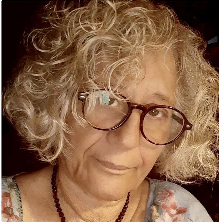
La chanteuse Philomène s'ouvre à l'écriture pour enfants

Deux nouveaux livres jeunesse viennent de sortir.