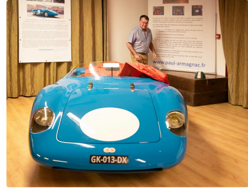
Dévoilement de la DB