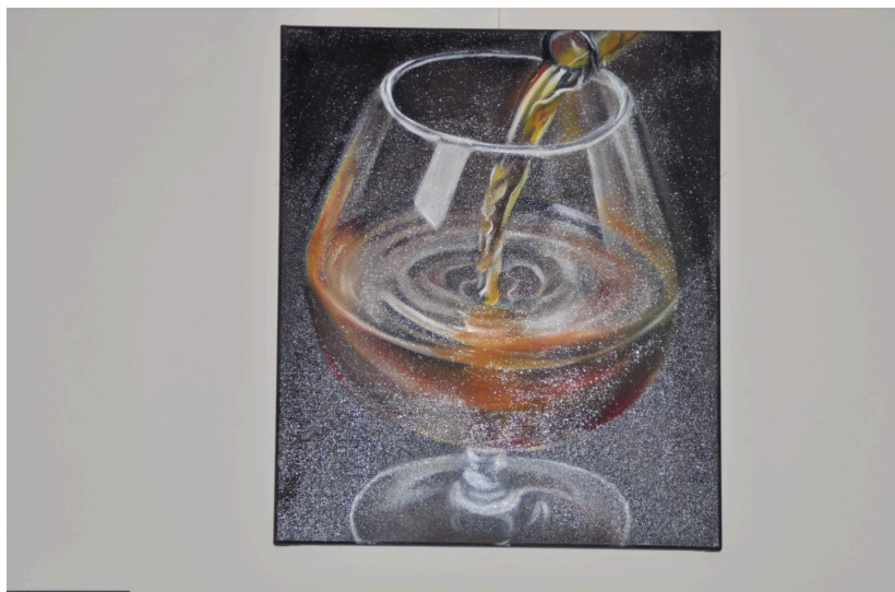
Tableau réalisé spécialement pour cette exposition

De la légèreté, un sentiment d'apaisement, c'est ce que vous propose Cécile avec cette exposition à l'Encantada à voir tous les jours du lundi au vendredi de 9 h à 18 h jusqu'à fin décembre.