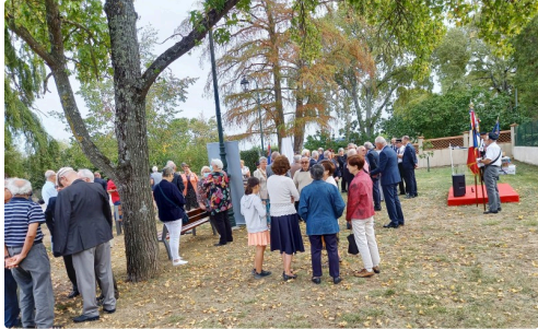
De nombreuses personnes ont assisté à la cérémonie.