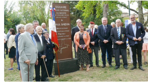
De nombreux bénéficiaires de l'Ordre national du Mérite étaient présents.