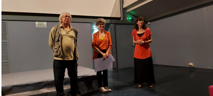
Une soirée ciné-débat autour d'un combat toujours d'actualité, la lutte contre la peine de mort

Mardi dernier, Cine Qua Non avait organisé une soirée ciné-débat à l'occasion de la 21 e édition de la journée de lutte contre la peine de mort autour du documentaire Sept hivers à Téhéran en présence des groupes locaux d' Amnesty International , de l' ACAT (Action des Chrétiens pour l'Abolition de la Torture) et de la Ligue des Droits de l'Homme .