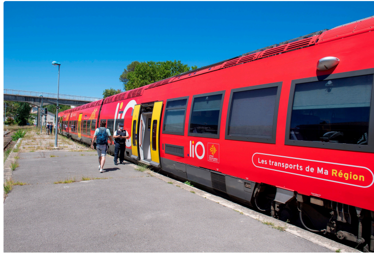
Boutonnet Laurent - Région Occitanie

Train à 1€ : un nouveau record de fréquentation avec plus de 134 000 voyageurs pour ce premier week-end d'octobre !