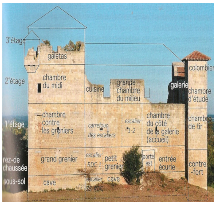
Dessin interprétatif de la distribution des pièces dans le château de Lagardère (projeté par le conférencier)

Puis au XIIe XIIIe siècle, on construit de véritables châteaux-forts en pierre, ou parfois en briques, ce qui est moins cher. Comme le château d'Espas et celui de Bascous. Et comme auparavant dans les tours "salles", les pièces d'habitation se trouvent au 2e et/ou au 3e étage.