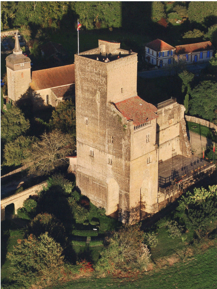
Le château de Termes-d'Armagnac (extrait de l'ouvrage présenté)