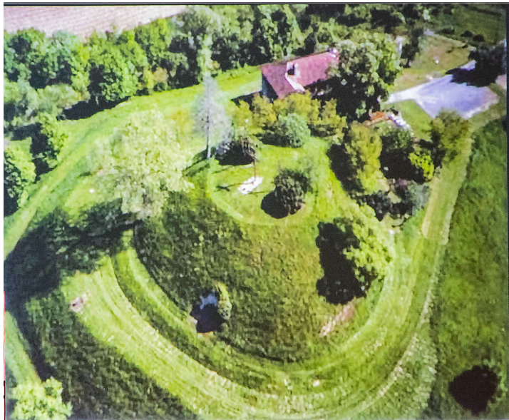
Motte de Moncassin (photo projetée lors de la conférence)