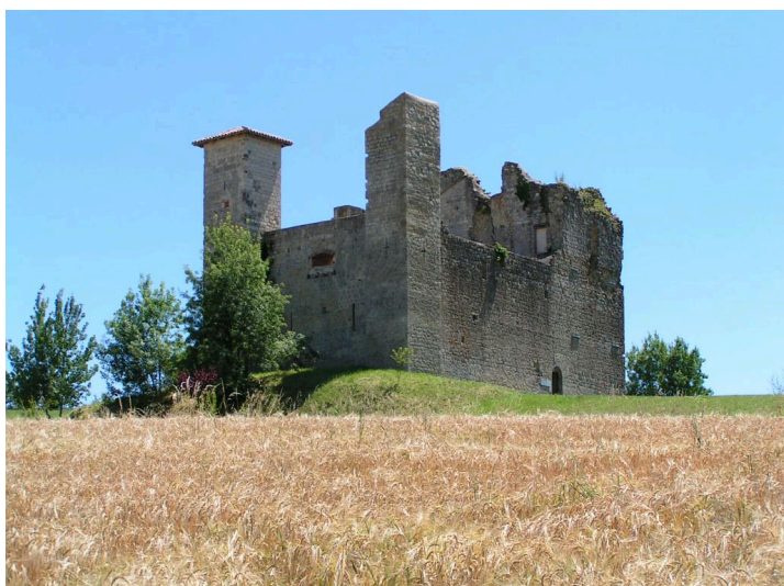
Château de Lagardère