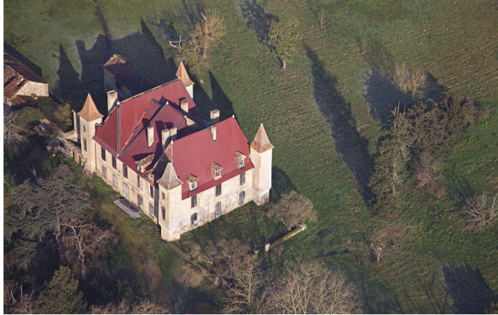
Le château de Saint-Julien à Cahuzac-sur-Adour (extrait de l'ouvrage présenté)