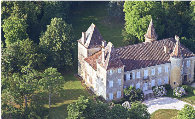
La présentation à Castex-d'Armagnac de la réédition du tome 1 de «Châteaux et belles demeures du Gers» a eu lieu

«Un patrimoine à protéger, à étudier, à aimer»