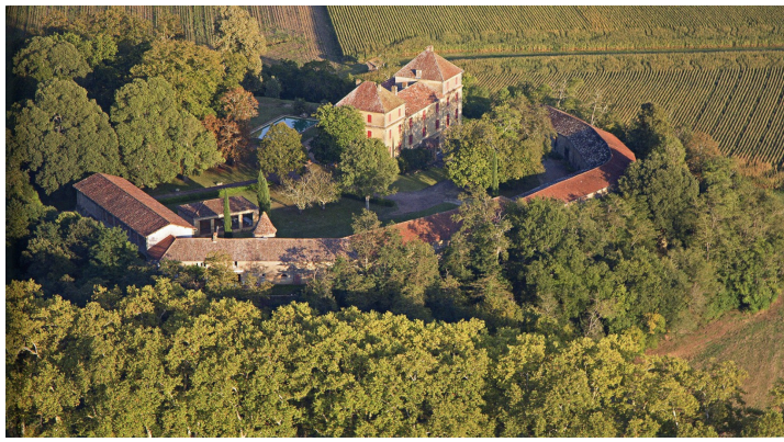
Le château de Barrau à Castex-d'Armagnac où a lieu la conférence (extrait de l'ouvrage présenté)