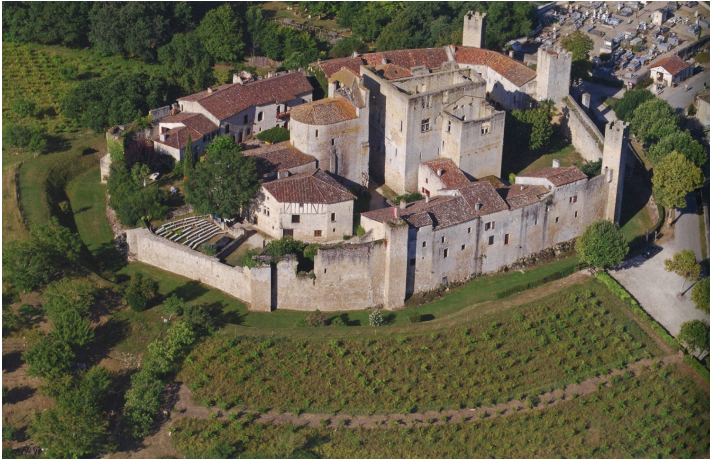
Château de La Ressingle (extrait de l'ouvrage présenté)

Pendant la Guerre de Cent Ans, en 1356, le Prince Noir entreprend une chevauchée : il détruit tout sur son passage et les bâtiments de l'époque ont beaucoup souffert.