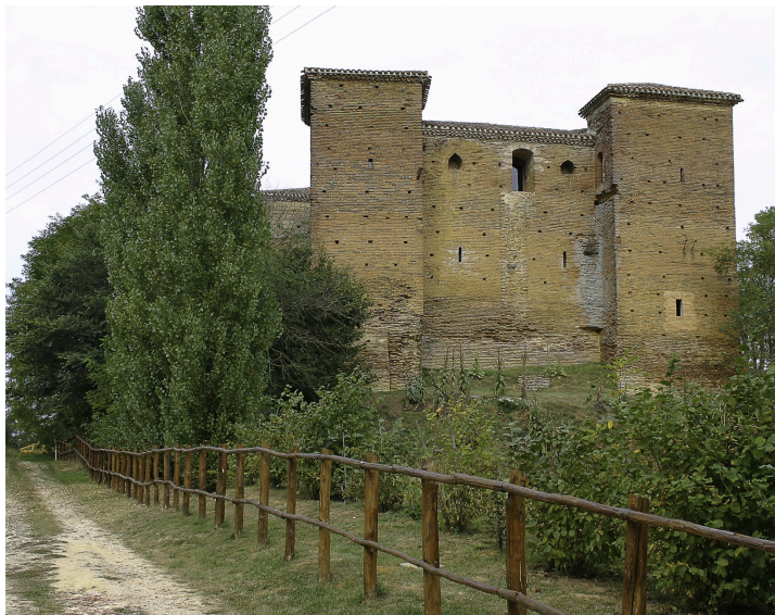
Le château d'Espas