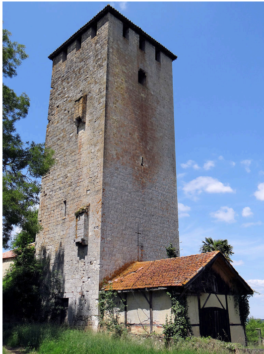
Tour de Lamothe à Cazeneuve