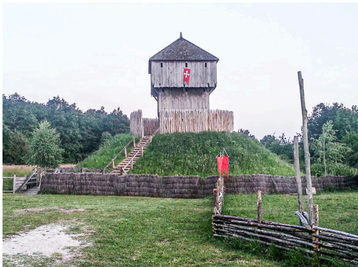
Grain de sel du rédacteur de cet article : Tour reconstituée à Saint-Sylvain d'Anjou (Indre).