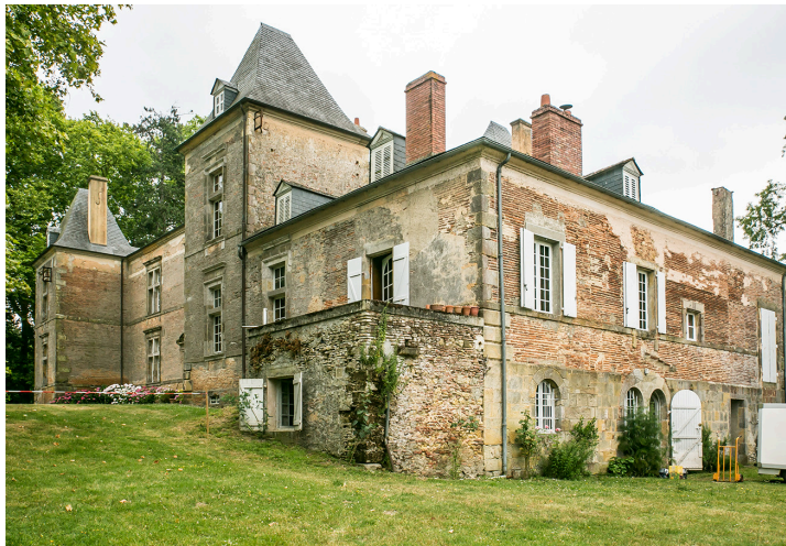
Château de Saint-Martin d'Armagnac