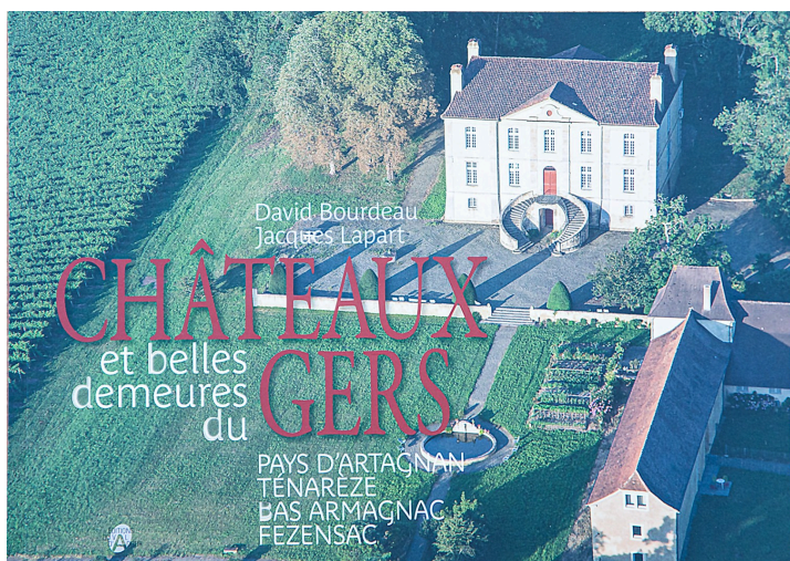
Couverture du tome 1 de l'ouvrage présenté (réédité) avec la photo du château de Viella

La chartreuse est une grande maison à simple rez-de-chaussée sur cave, composée d'un long bâtiment central symétrique, encadré ou non par deux pavillons en avant-corps (Wikipedia).