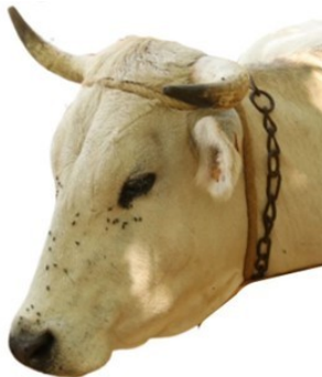
Dimenjada occitana 42/23