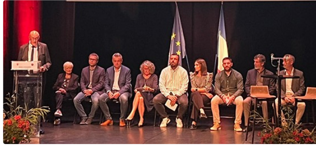
Le bilan du conseil municipal à mi mandat

Un vaste tour d'horizon dans tous les domaines