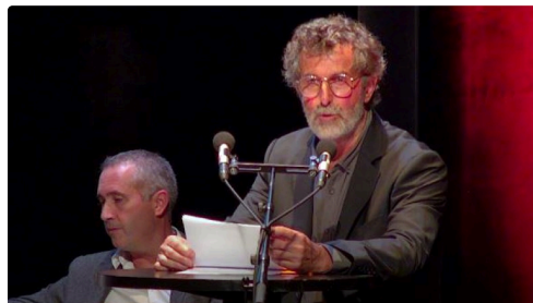
condom maire mi mandat 285.JPG