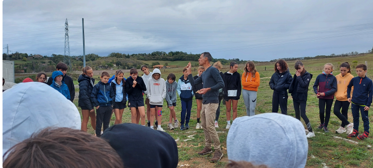
L'ère de Cauderon envahie par une multitude de supers héros!

« Vous êtes des supers héros qui allez sauver l'humanité et la planète ! »